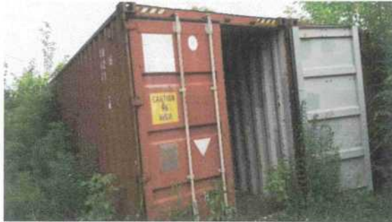
Fot. 2 - kontener dodatkowy nr 1 (nieuszkodzony)