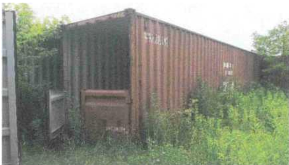
Fot. 4 - kontener dodatkowy nr 2 (uszkodzony)