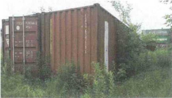
Fot. 1 - kontener dodatkowy nr 1 (nieuszkodzony)