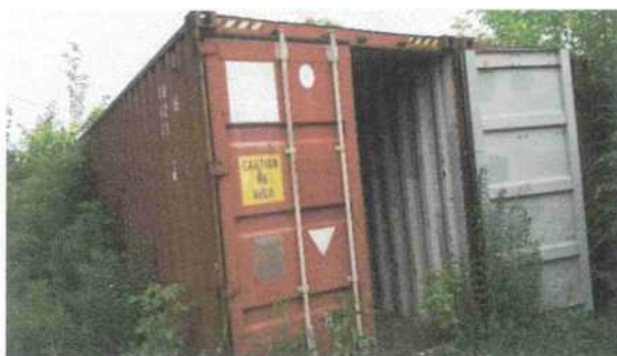
Fot. 2 - kontener dodatkowy nr 1 (nieuszkodzony)