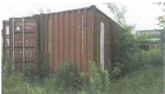
Fot. 1 - kontener dodatkowy nr 1 (nieuszkodzony)